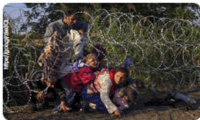
■ Migrantes sirios cruzan debajo de una cerca al entrar en Hungría en la frontera con Serbia, cerca de Roszke, 27 de agosto de 2015.